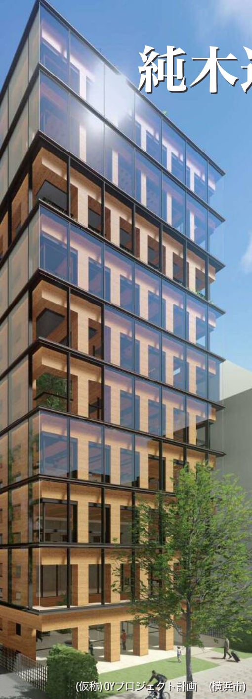
(仮称) OYプロジェクト計画 (横浜市)