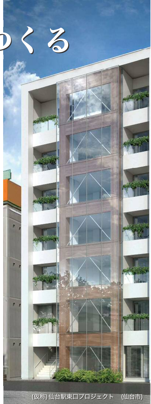
(仮称) 仙台駅東口プロジェクト (仙台市)