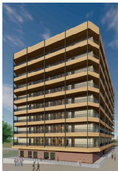
(仮称)玉川学園 学生寮

建設地：東京都町田市 階数：純木造 地上9階 規模：延べ面積 6,150㎡ 最高高さ：30.68m 用途：学生寮 設計：株式会社久米設計