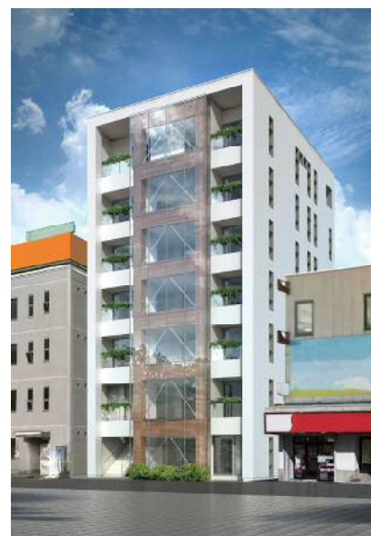
(仮称)仙台駅東口プロジェクト

建設地：宮城県仙台市 階数：純木造 地上7階 規模：延べ面積 1,029㎡ 最高高さ：26.5m 用途：テナント、オフィス、専用住宅 設計・施工：株式会社シェルター