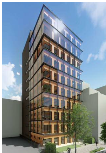
(仮称)OYプロジェクト計画

建設地：神奈川県横浜市 階数：純木造 地上11階、地下1階 規模：延べ面積 3,488㎡ 最高高さ：44.1m 用途：自社研修・宿泊施設 設計・施工：株式会社大林組