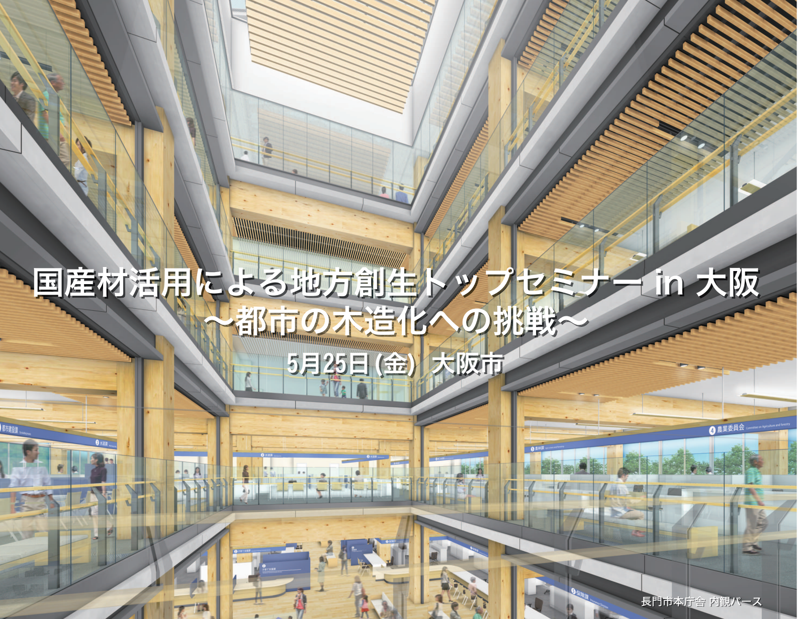
長門市本庁舎 内観パース

この度「国産材活用による地方創生トップセミナー」を大阪市内で開催致します。 日本は世界有数の森林国でありながら、木材の自給率は3割程度に留まっているのが現状です。地域の木材を活用し、日本の林業を復活させることは、環境面のみならず地方創生・持続可能な社会の形成において非常に有効です。