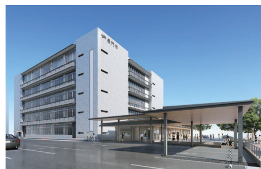
長門市本庁舎 外観パース

本セミナーでは、国産材の先駆的活用事例を御紹介致します。是非この機会にお越し頂きたく、ご案内申し上げます。