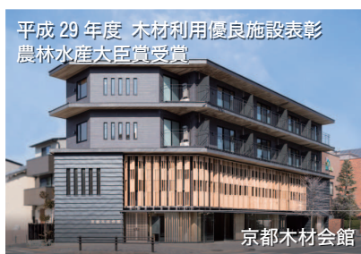
平成 29 年度 木材利用優良施設表彰 農林水産大臣賞受賞