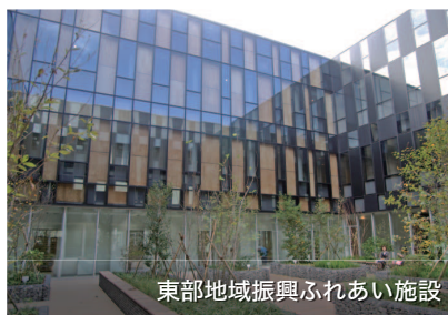
東部地域振興ふれあい施設